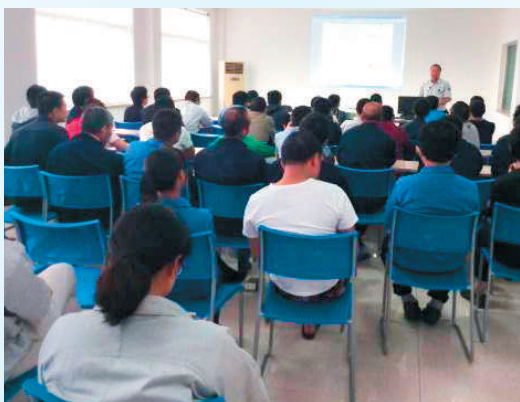
一线员工安全培训

6月，得邦工程塑料面向员工开展了消防安全知识培训和安全操作规程培训，通过培训提升了员工的安全意识和安全技能，使他们了解了各自岗位的安全风险、预防措施和应采取的职业健康安全防护。