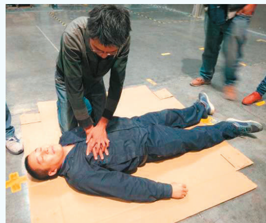
触电急救 (下转第5版)