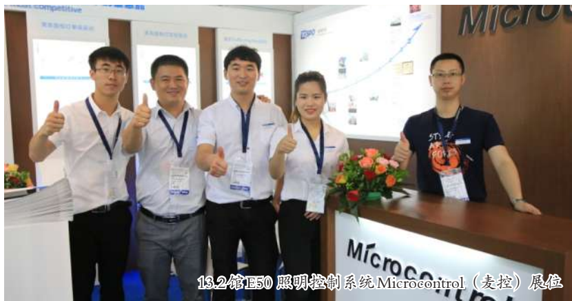
13.2馆E50 照明控制系统Microcontrol (麦控) 展位